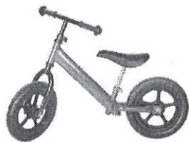
3-5 éves korosztály

koordinációjukat, figyelmüket és kitartásukat. Az tér-irány fejlesztésében is az egyik legjobb eszközünk. A szabad biciklire várakozás türelmet és fegyelmet tanít. Igyekeztünk alaposan utánajárni melyik a legmegfelelőbb tanulóbicikli az óvodás korosztály számára. Figyelembe véve a kis- és nagycsoportosok közötti magasságkülönbségeket, két féle méretű futóbiciklit vettünk, így minden korosztály biztonsággal tudja használni a játékot.