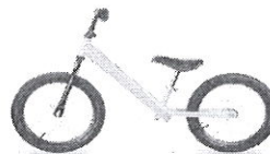
5-7 éves korosztály