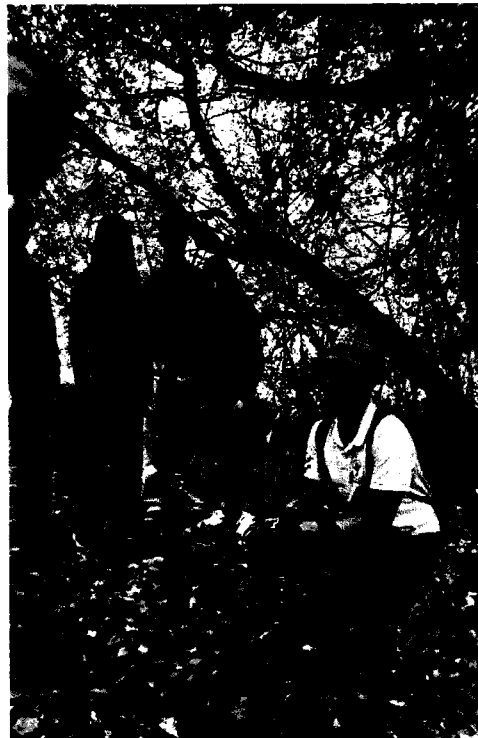
Gyógynövénytúra a Fenntarthatósági napon, 2023.10.14.