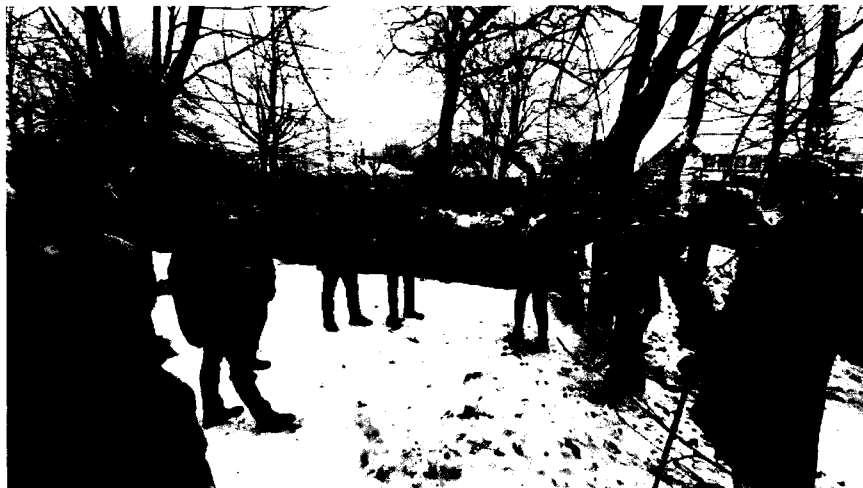
Előadás a komposztálásról, 2023.12.09.

A harmadik program december 9-én reggel 9 és délután 13 óra között a komposztálás témája körül forgott. Ezen a napon is volt civil együttműködő vendégünk, mégpedig a Fák a Rómain csoportnak két tagja, akik már más alkalommal is megfordultak a pihenőparkban. Mivel a parkban sok lombhullató fa él, kézenfekvő volt már évekkal ezelőtt beszerezni néhány komposztálóládát és azóta rendszeresen fel is használjuk a bennük készült komposztot a Pihenőparkban, például a fűszerspirálban és a levendula ágyásban.