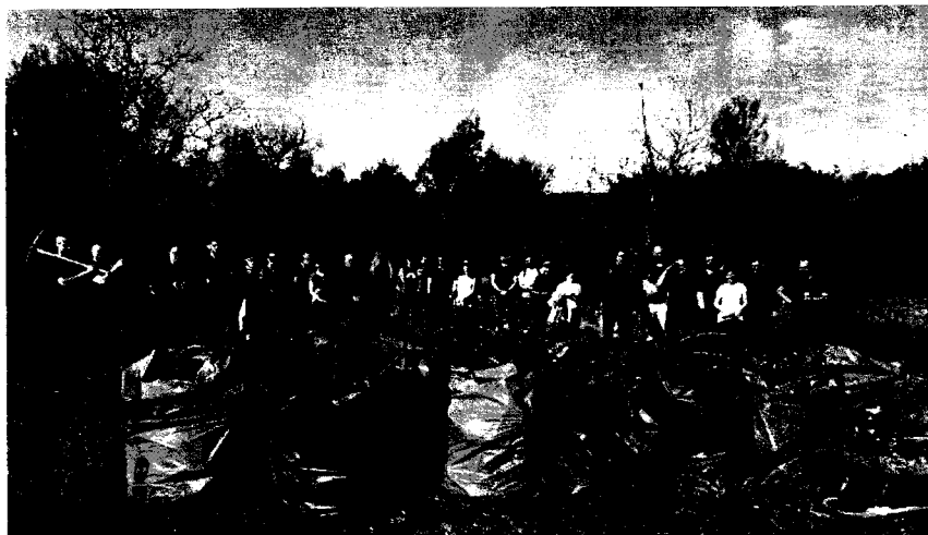
Hulladékgyűjtés a Mocsárosdűlőben az ALTEO Nyrt. munkatársaival, 2023.10.13.

Az Alteo munkatársai az országban található különböző munkahelyekről érkeztek, legalább ötvenen voltak és egész délelőtt a Mocsárosdűlő négy, előre tervezett pontján gyűjtötték össze, zsákolták az ott felhalmozódott szemetet, szerves hulladékot (kábelek, gumibroncsok, építési törmelék), amit már az évek nagyrészt betemettek, azaz szó szerint a föld alól kellett kemény fizikai erővel kigyűjteni. Összesen körülbelül 100 zsák szemet gyűlt össze. A munkavégzés helyét a Fővárosi Természetvédelmi Őrszolgálat munkatársai jelölték ki, ők is részt vettek a szemétygyűjtésben. Meghívásunkat elfogadta és jelen volt a FŐKERT Kertészeti divíziójának munkatársa is.