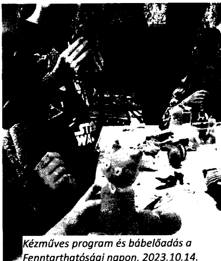
Kézműves program és bábelőadás a Fenntarthatósági napon, 2023.10.14.