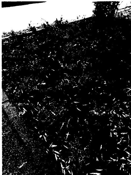
A határkö környezete a rendezés után

Itt szeretnénk felhívni az önkormányzati képviselők figyelmét arra, hogy a Határ úti határkövek 2021-es felállításkor elhangzott egy ígéret, ami szerint a főváros 150. születésnapjára a kövek megtisztítása, restaurálása és az egyiken lévő fémtartozék pótlása megtörténik. Ez az ígéret teljesítetlen maradt, pedig az idő vasfoga meglehetősen kikezdte már mindkét kő feliratait. Fővárosi, harmadik kerületi polgárokként sokkal több odafigyelést kérünk ezekre a csak látszólag nem jelentős, politikamentes feladatokra, hogy ne kelljen minden lehetséges helyzetben csalódást átélnünk.