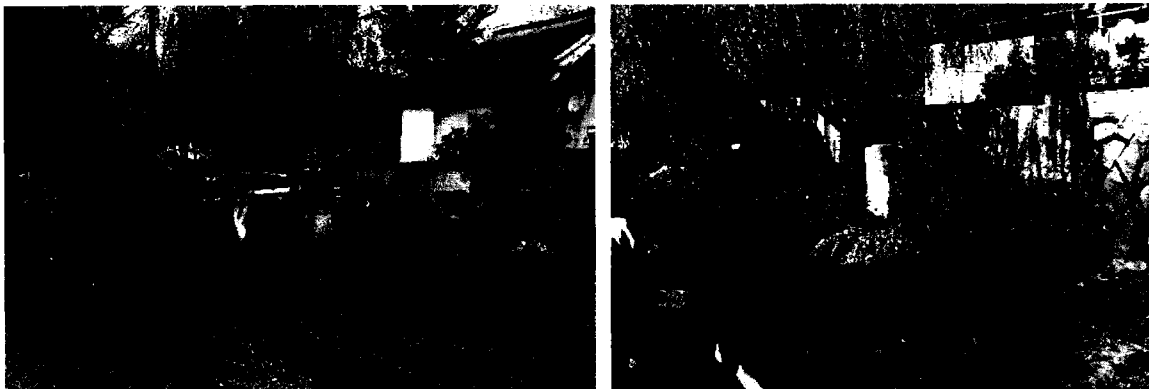
Területrendezés, az ültetés megkezdése

Először a régen levágott, elszáradt fűzfagallyaktól kellett megtisztítani a földet és teherautóval kellett elszállítani a lakók által ott felhalmozott szemetet, elszáradt zöldhulladékot.