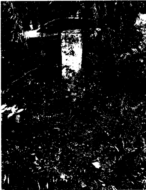
A határkő környezete a rendezés előtt

Az egyik követ gondos lakók tartják rendben, nincs tennivalónk vele, a fű levágva, virág és a körbejárást támogató bazaltkocka térkirakás övezi. A másik kő nem ilyen szerencsés, ezért idén a „Fogadj örökbe...” pályázat keretében rendeztük a kő környezetét.