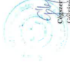
Cégszerű aláírás, pecsét Gólyáné Kaszás Erzsébet