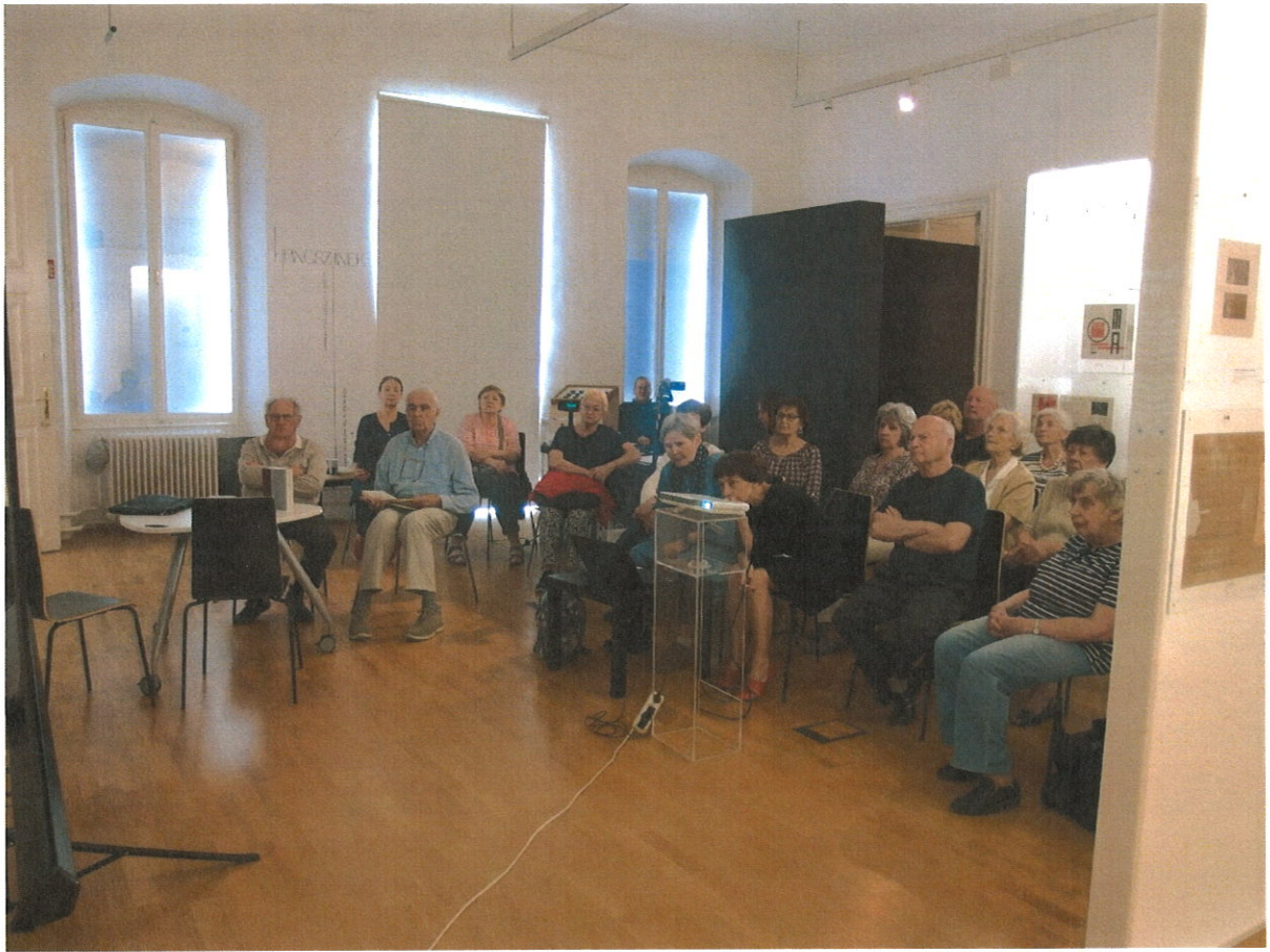
2023.06.02. Szomszédolás – Vendégségben Kassáknál