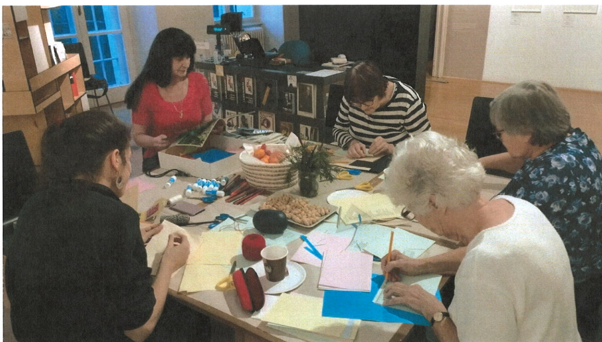
2023.12.14. Délutáni bolyongó - Jövőnapló