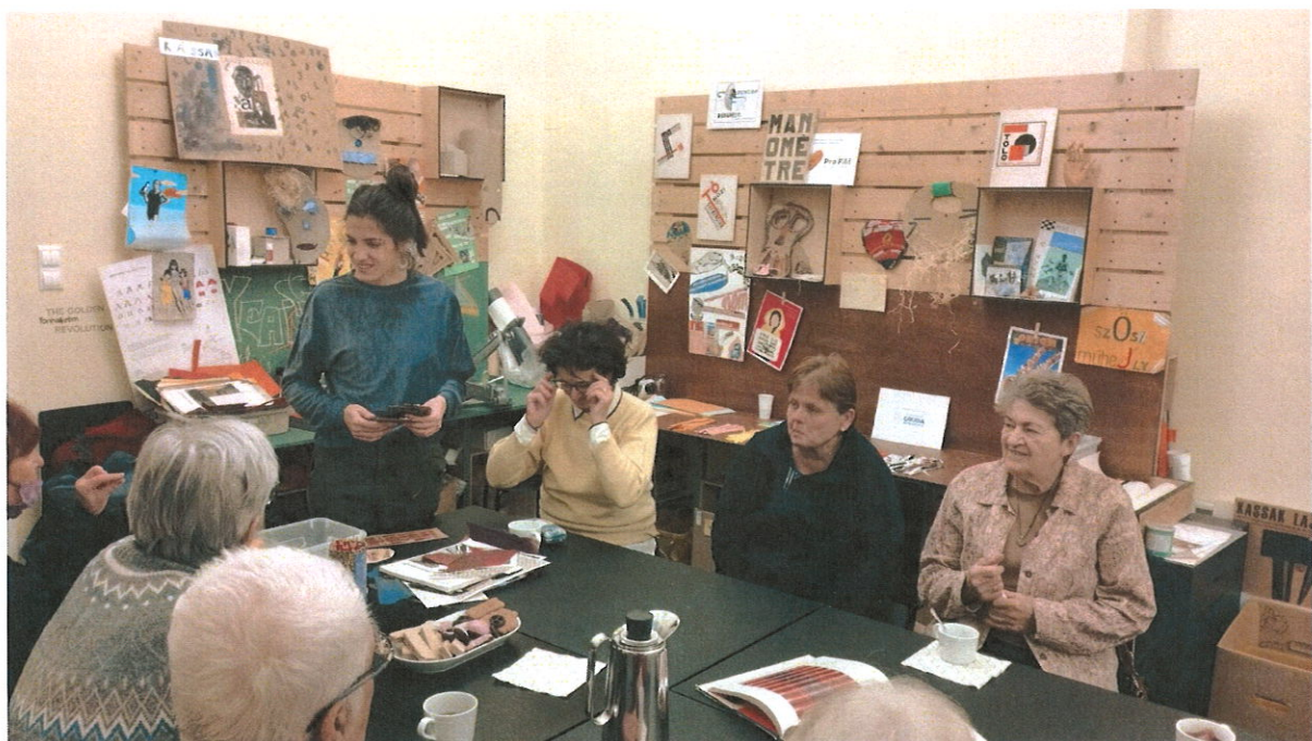
2023.11.30. Konstruktivista szövöde