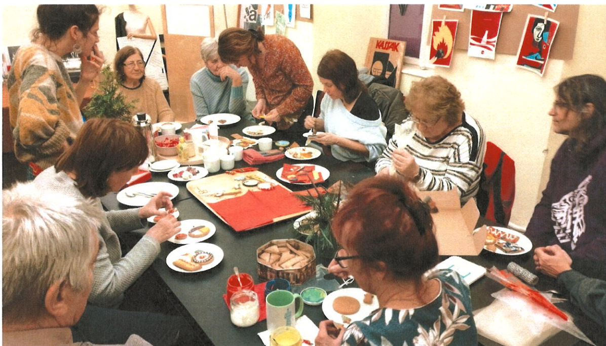
2023.12.09 Avantgárd teadélután – Mézeskalácsműhely