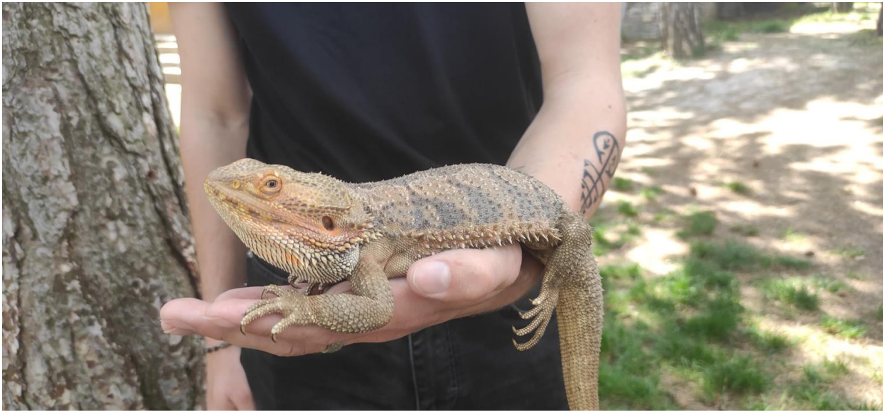
És a bébi kiráлыпiton.