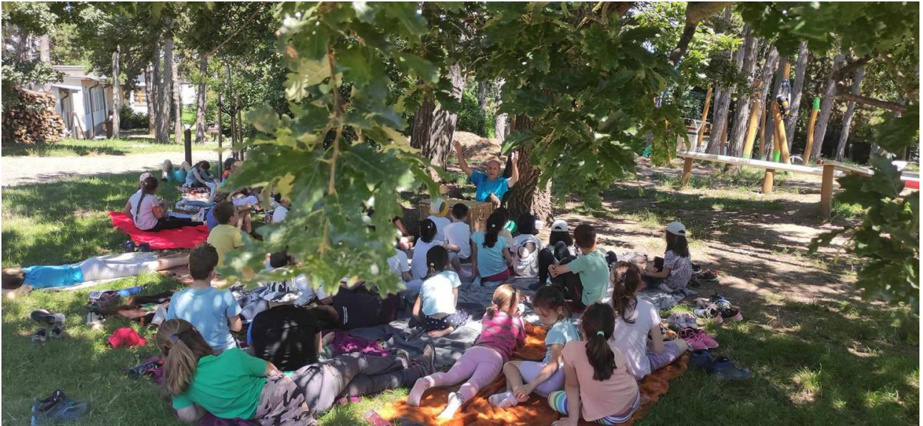
Hüllős bemutatkozó, nagyon tetszett a gyermekeknek, hihetetlen sok kisgyermek kedvence.