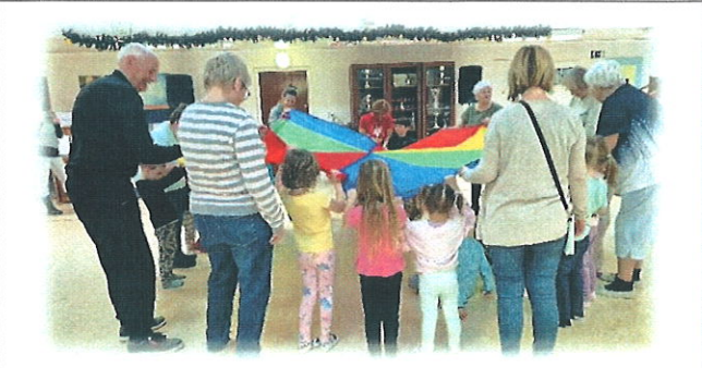
Mesedélelőtt + Zumba