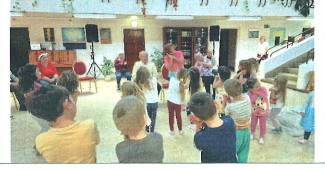
Múzeum- és zoopedagógiai foglalkozások